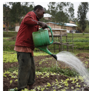
tot coaching van ondernemers in het Zuiden