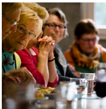
over grotere partnerschappen