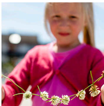
Van financiële steun aan lokale organisaties

Projecten en samenwerkingen zijn er in alle maten en gewichten: