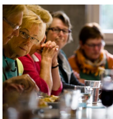
over grotere partnerschappen