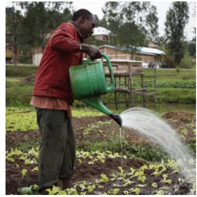
tot coaching van ondernemers in het Zuiden