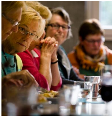
over grotere partnerschappen