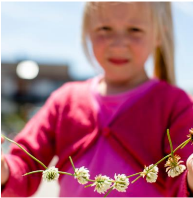
Van financiële steun aan lokale organisaties

Projecten en samenwerkingen zijn er in alle maten en gewichten: